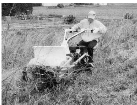
貸し出しされる歩行型草刈機

お問い合わせは、協議会事務局（市産業振興課（市役所4階 ☎32・3809）または、市農業委員会事務局（市役所4階 ☎32・3810））まで。