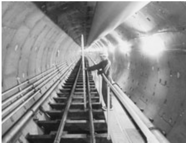
雨水流下管：内径3.5メートル