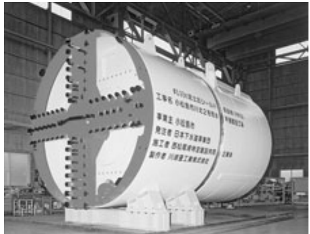
掘進機：愛称 ほりすすむくん

ミリカホール前に建設中の小松島雨水ポンプ場 全長708.2メートルの雨水流下管の掘削現場