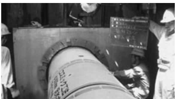
汚水管渠推進工事状況