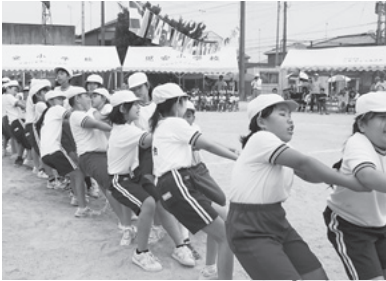
児安小学校 運動会