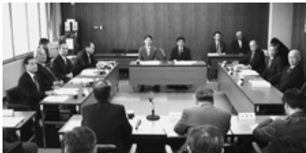
総務産建常任委員会

は不採択、陳情第三号「非核自治体宣言」を基とした平和行政を求める件については、継続審査にすべきものと決した。不採択の理由