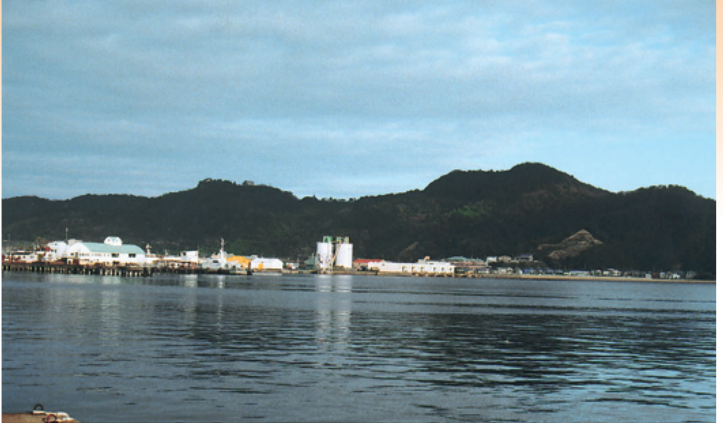
新しい年を迎えた小松島港