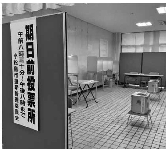
市役所1階ロビーの期日前投票所

事務従事者等のお手伝い、あるいは投票所の状況等を確認していただけるだけの対策をしていきたい。