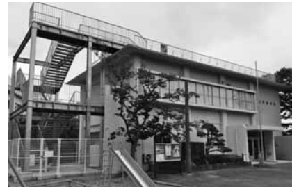
津波避難階段が設置された和田島公民館

の転出超過率が高いことが示されており、阿南市と徳島市への転出がほとんどである。今の小松島には、若者世代に特化した定住施策が必要で最重要課題と捉え若者定住促進条例を制定し、若者世代に予算を重点化し、未来への投資と考え取り組むべき。 総務部長 人口減少は本当に喫緊の問題で、人口の減少により交付税自体も大きく減っている現状で早急に効果的な対策を考える中で先進的な取り組みも参考に検討したい。