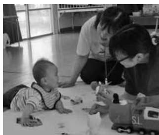
さかの認定こども園

社会における公共施設の適正管理、少子化による教育・保育ニーズへ対応できる子育て支援策の充実を図るため、幼児教育保育料無償化や在宅育児支援クーポン事業等を実施する予定である。今後多様な支援を進める体制づくりに努めたい。