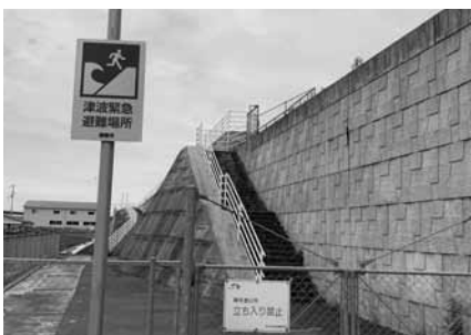
四国横断自動車道 津波避難施設（徳島市）

南部 小松島市の空き家対策において、老朽化した危険な空き家を除去するための補助金を交付。補助実績14軒。空き家バンクでは登録の全4軒中、2軒が成約。大きな成果が見えない。空き家事業は市が主となって行っていく事業なのか。民間の団体を積極的に活用しては。 産業建設部長 民間等と手を携えることで地域の活性化、街の魅力向上につながる施策を検討する。