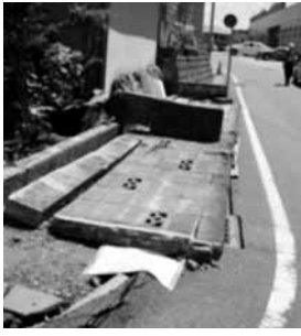
ブロック塀倒壊現場

では学校施設等の耐震化やいのち山整備、金磯ポンプ場や葬祭場の建設和田島会館改修に伴う避難施設整備、防災無線の整備等がある。ソフト面では、地域防災計画や津波避難計画、業務継続計画、避難所運営マニュアル、初動マニュアル等の策定や津波ハザードマップを作成している。今年度の4月より市のホームページにウェブのハザードマップを掲載している。総合防災訓練を今年度10月20日に芝田小学校で行う。災害時のトイレ