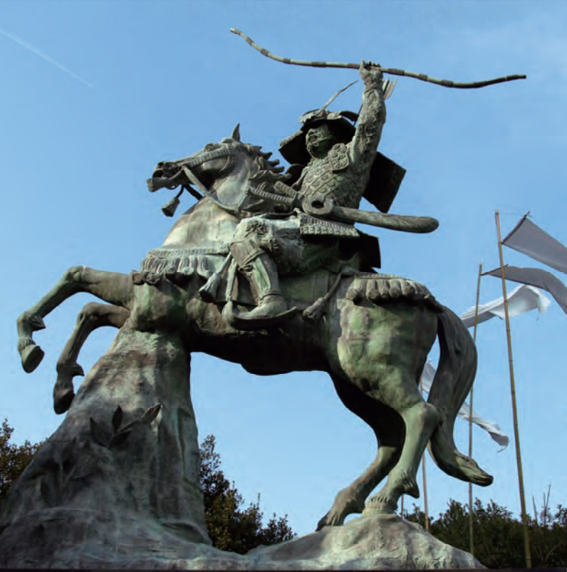
小松島商工会議所