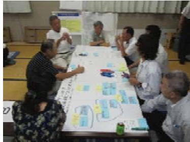
写真：（参加者どうしの意見交換）