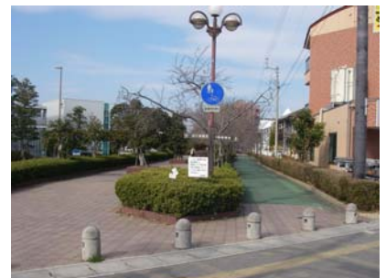
自転車歩行者専用道路

道路などの生活基盤施設の整備改善を進め、子どもや高齢者、障がい者など、誰もが安全で快適に暮らせる都市づくりを目指します。