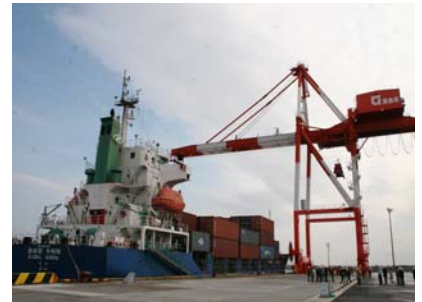
徳島小松島港コンテナターミナル (赤石地区)

市民生活の安定と向上を図るため、産業構造の変化に対応した土地利用の規制・誘導や都市施設整備を進め、活力ある地域産業を育む都市づくりを目指します。