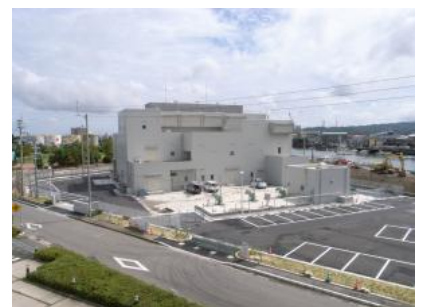
小松島雨水ポンプ場

自然災害から市民の生命と財産を守るため、ハード・ソフト施策の両面から防災・減災対策を進めるとともに、自助・共助・公助による協働の取り組みを強化し、災害に強く安心して暮らせる都市づくりを目指します。