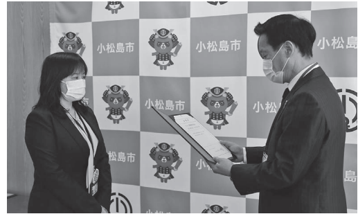
委嘱状交付式の様子 (ヤマト運輸)

今回委嘱されたヤマト運輸株式会社の担当者の方は「配達時の見守りを通して、地域で生活している方々の安全安心に寄与していきたい」、株式会社ファミリーマートの担当者の方は「地域に根ざすコンビニにしていきたい」と述べられました。市としても今後、消費者協力団体とともに、更なる市民の方の安全安心なくらしの実現のため、消費者被害のないまちを目指します。