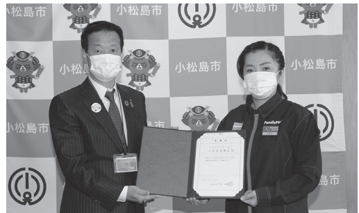
委嘱状交付式の様子 (ファミリーマート)