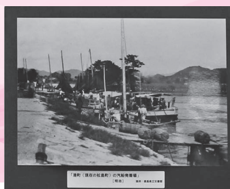
「漁船(魚船)の漁船が並ぶ港」 (昭和)