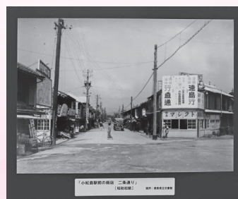
「小松島駅前商店街の二重通り」 (昭和初期)

今年、小松島市が市制施行70周年を迎えることから、70周年記念として、昔の小松島の様子を写した写真などの展示会「あゆみ写真展」を3月22日から30日にかけてショッピングプラザルピアで開催しました。展示されたのは市民の皆様からご提供いただいた写真などで、明治から平成の各時代に分けて公開。多くの市民の方がご来場されました。