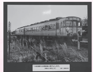
「小松島駅を通過する東横線の列車」 (昭和10年代前半)