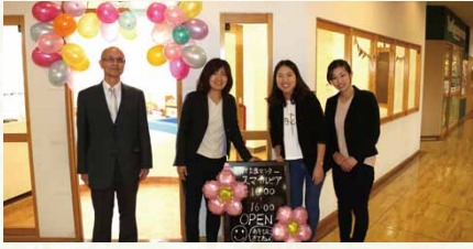
平成30年／子育て支援センター「スマイルピア」開設