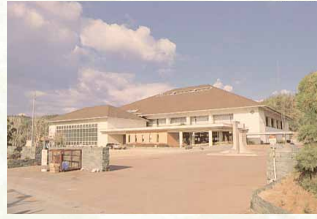
昭和57年／市立体育館完成