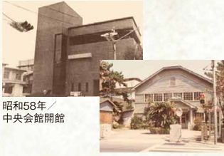
昭和58年／中央会館開館