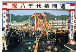
平成3年／八千代橋完成