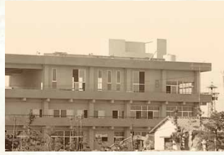
昭和49年／目佐厚生福祉解放センター完成