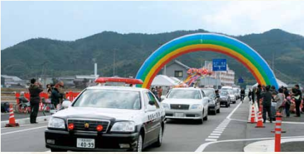
平成20年／県道花園日開野線バイパス開通