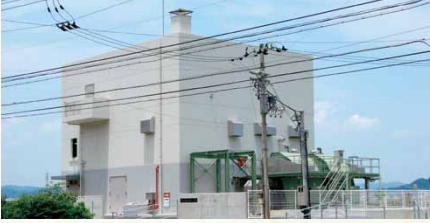
平成20年／勢合雨水ポンプ場完成