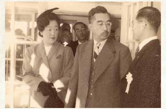
昭和28年 / 天皇、皇后両陛下ご来市(国民体育大会)