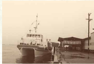
昭和57年／高速艇マリンホーク就航