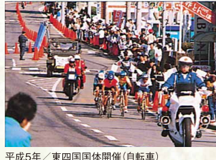
平成5年／東四国国体開催(自転車)