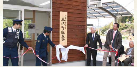
平成25年／立江町駐在所落成