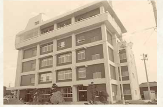
昭和47年／厚生福祉解放センター完成