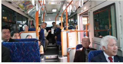
平成27年／市営バス廃止