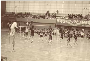
昭和59年／全国美業団バレーボールリーグ開催