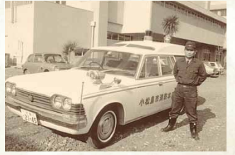
昭和45年／市消防署救急業務開始