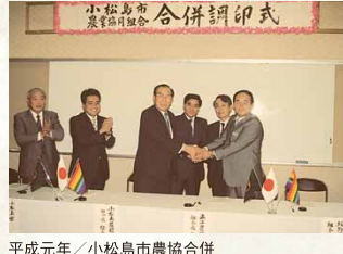
平成元年／小松島市農協合併