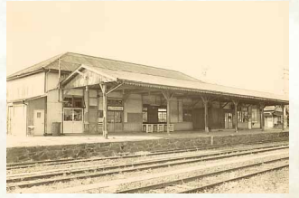
昭和60年／旧国鉄小松島駅舎