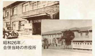
昭和26年 / 合併当時の市役所