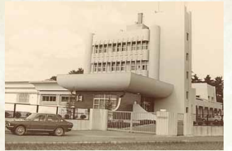
昭和47年／田浦浄水場完成(水道部)