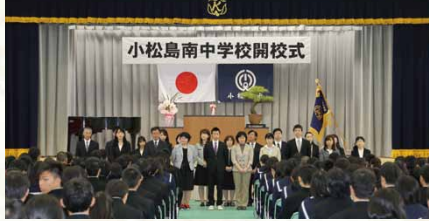
平成28年／小松島南中学校開校