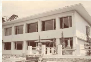
昭和52年／泰地総合センター完成