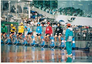
平成6年／ふるさとダービー小松島開催