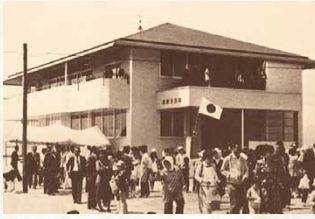
昭和57年坂野公民館改築