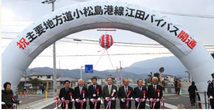
平成31年／主要地方道小松島港線「江田バイパス」開通