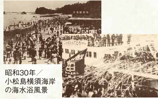
昭和40年 / 小松島市の 中学校卒業生の集団就職