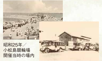
昭和25年 / 小松島競輪場 開催当時の場内