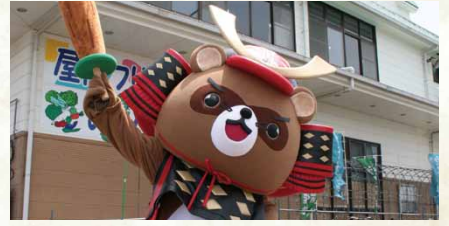
平成24年／観光PR用マスコット「こまボン」誕生