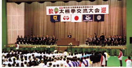
平成15年／ねんりんピック太極拳交流大会開催