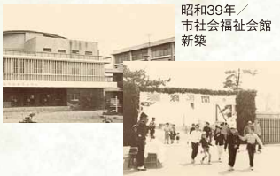
昭和39年 / 市社会福祉会館 新築