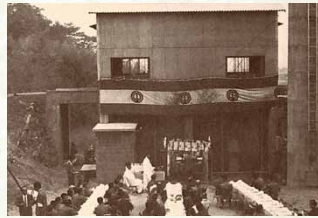
昭和38年 / 市営ゴミ焼却場完成