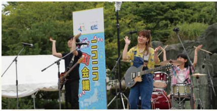
令和元年／小松島まつりに合わせ「ニコニコ町会議」開催