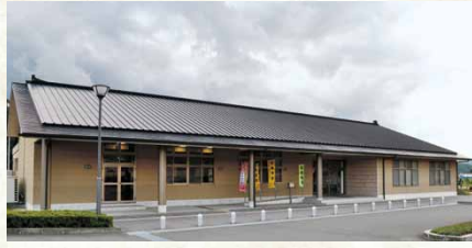
平成14年／ふれあいセンター立江完成