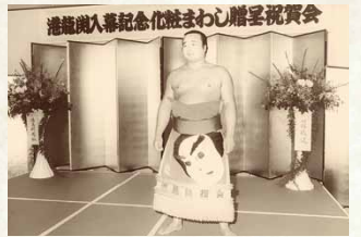
昭和61年／港龍閣新入幕