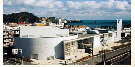
平成11年／保健センターミリカホール完成