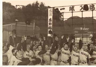
昭和63年／小松島西高校選抜高校野球大会初出場