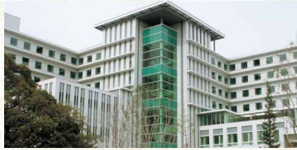
平成18年／徳島赤十字病院新築・移転