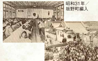
昭和31年 / 坂野町編入