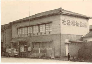
昭和35年 / 社会福祉会館開設