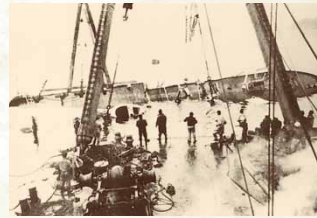
昭和33年 / 南海丸沈没遭難事故