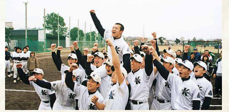
平成13年／小松島高校選抜高校野球大会初出場