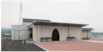
平成29年／新葬祭場完成