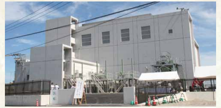
平成26年／金機ポンプ場完成