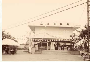
昭和55年／立江公民館改築