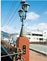
平成8年／千歳橋架け替え完成