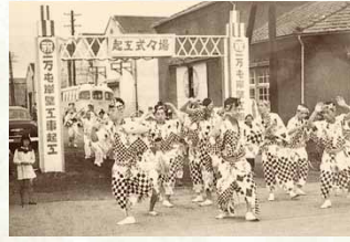
昭和30年 / 小松島港1万トン岸壁着工