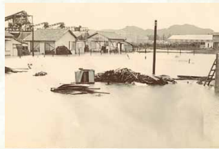
昭和36年 / 第二室戸台風来襲