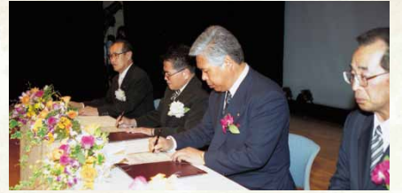
平成13年／友好都市調印式