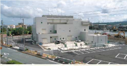
平成19年／小松島雨水ポンプ場完成