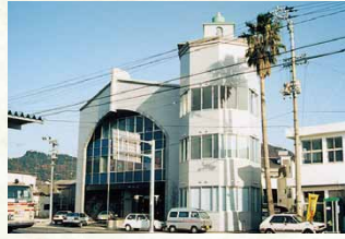
平成4年／市総合コミュニティセンター完成