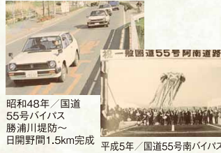
昭和48年／国道55号バイパス 勝浦川堤防～日開野間1.5km完成