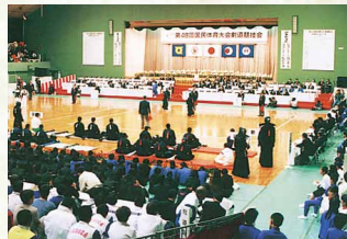
平成5年／東四国国体開催(剣道)