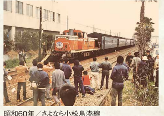
昭和60年／さよなら小松島港線