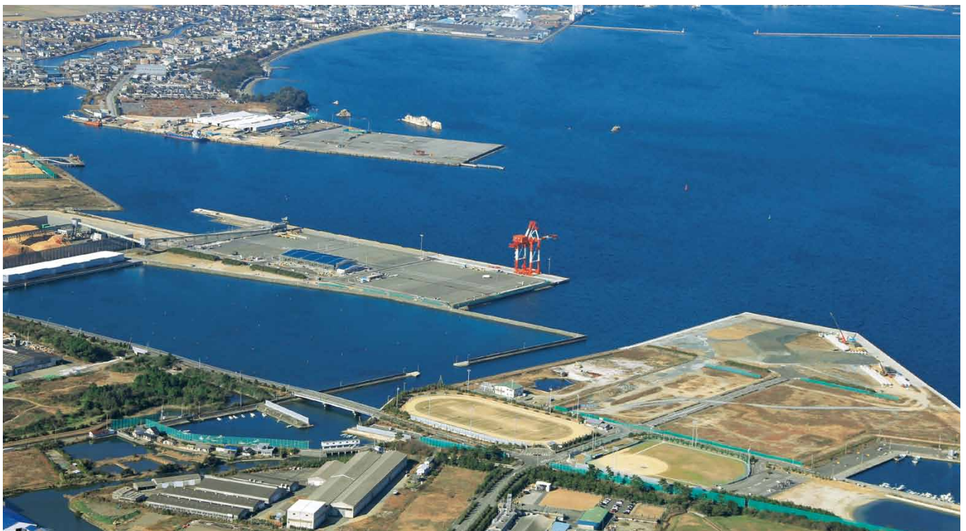
小松島港赤石地区大型公共埠頭

小松島港が昭和二十三年に外国貿易の開港場に指定されて以来六十年余。関西国際空港の開港、鳴門・明石海峡大橋の全通、さらには四国縦・横断自動車道の整備により、大阪湾ベイエリアに臨む小松島市にとって、小松島港は産業経済発展の中核であり、現在、小松島港に入ってくる外国船は年間約三五〇隻。その大半がアジア・アメリカなどから木材や紙の原料となるチップを運んでくる船で、小松島港は日本有数の木材の輸入港であり、徳島県における外貿の拠点となっています。