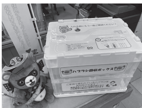
ハブラシを持った「こまポン」が目印