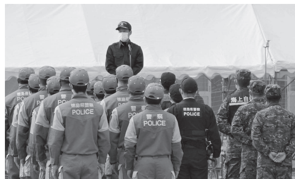
訓練の講評を行う中山市長(奥)