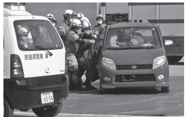
土砂埋没車両救助訓練の様子

11月14日、坂野運動広場・坂野体育館にて令和3年度小松島市総合防災訓練が実施され、多くの市民の方々が訪れました。防災に関する体験ブースが開かれたほか、今年は自衛隊・警察・消防などの各種防災機関による実動訓練も実施。訪れた方々は実動訓練の様子を見学し、防災意識を高めていました。