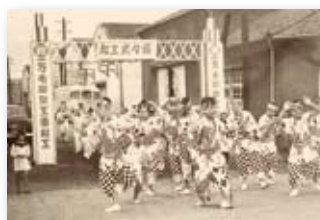
昭和30年／小松島港1万トン岸壁着工