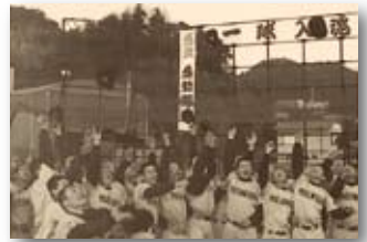
昭和63年/小松島西高校選抜高校野球大会初出場