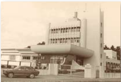
昭和47年／田浦浄水場完成(水道部)