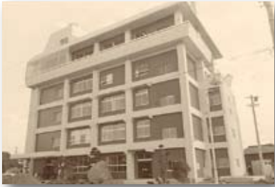
昭和47年／厚生福祉解放センター完成