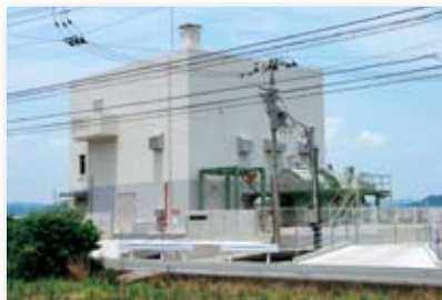
平成20年／勢合雨水ポンプ場完成