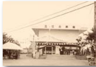
昭和55年／立江公民館改築