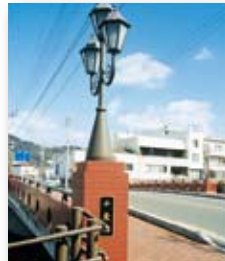
平成8年/千歳橋架け替え完成