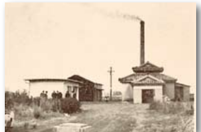
昭和40年当時／旧葬斎場改築