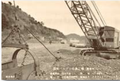
昭和43年／山陽国策パルプ(株)小松島用地造成