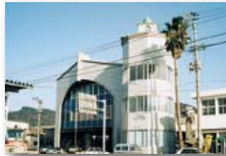
平成4年/市総合コミュニティセンター完成