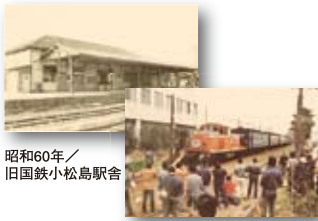
昭和60年／旧国鉄小松島駅舎