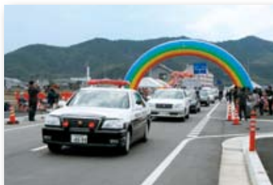
平成20年／県道花園日開野線バイパス開通