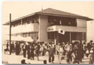
昭和57年坂野公民館改築