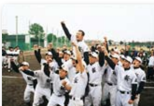
平成13年/小松島高校選抜高校野球大会初出場