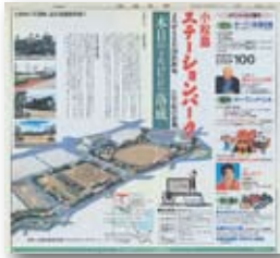
平成5年/ステーションパーク完成