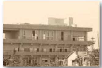
昭和49年／目佐厚生福祉解放センター完成