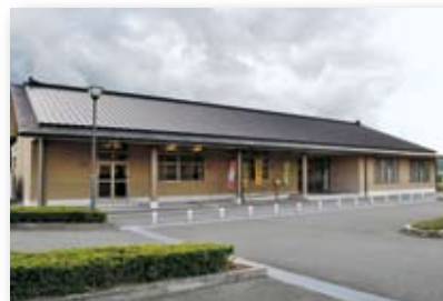
平成14年／ふれあいセンター立江完成