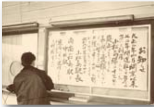
昭和60年／国鉄小松島港線廃止