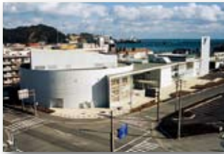
平成11年/保健センター・ミリカホール完成