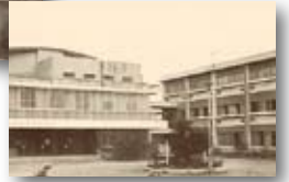
昭和39年／市社会福祉会館新築