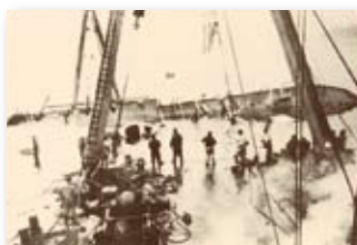
昭和33年／南海丸沈没遭難事故