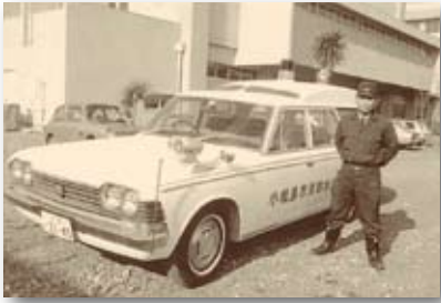
昭和45年／市消防警救急業務開始