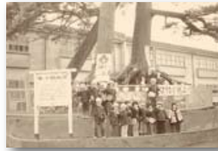
昭和55年／さよなら根上り松