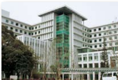
平成18年／徳島赤十字病院新築・移転