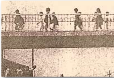
昭和43年／初の道路横断歩道橋完成(千代小学校前)