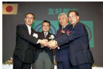
平成13年／市制50周年記念式典