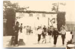
昭和40年／小松島航空隊開隊