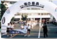
平成9年/ 第12回海の祭典開催