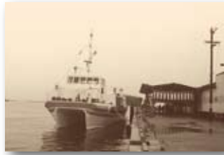
昭和57年／高速艇マリンホーク就航