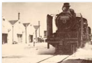
昭和29年／発着の貨物は臨港鉄道その他によって目的地へ、倉庫へと運ばれる。