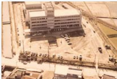
昭和43年／市役所新庁舎完成