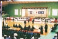
平成5年/東四国国体開催 (剣道)