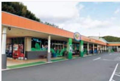
平成18年／あいさい広場オープン