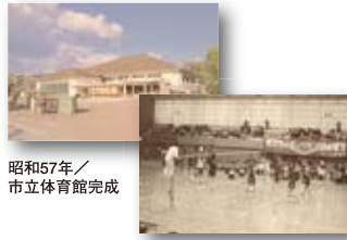
昭和57年／市立体育館完成