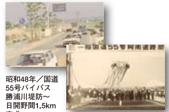
昭和48年／国道55号南バイパス勝浦川堤防～日開野間1.5km完成 平成5年／国道55号南バイパス小松島～阿南間開通