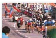
平成5年/ 東四国国体開催 (自転車)