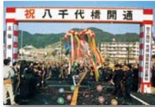
平成3年/八千代橋完成