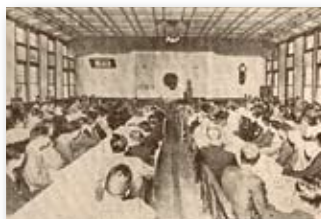
昭和40年／小松島市の中学校卒業生の集団就職