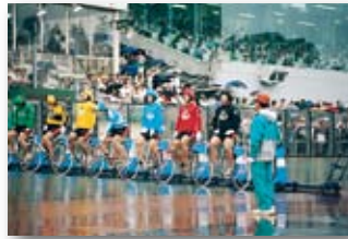
平成6年/ふるさとダービー小松島開催