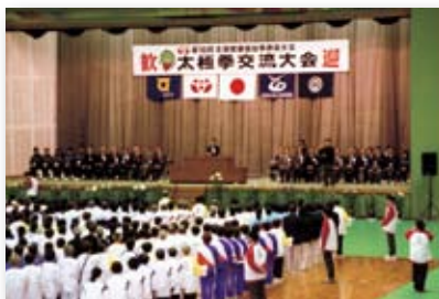
平成15年／ねんりんピック太極拳交流大会開催