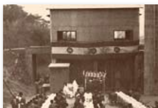
昭和38年／市営ゴミ焼却場完成