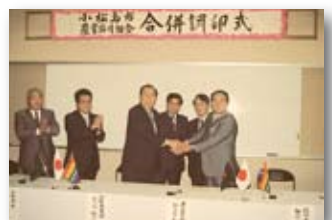
平成元年/小松島市農協合併