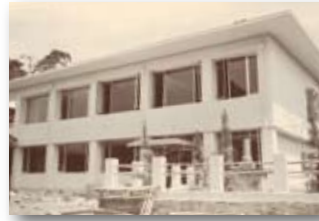
昭和52年／泰地総合センター完成