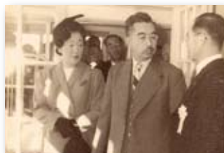
昭和28年／天皇、皇后両陛下ご来市（国民体育大会）