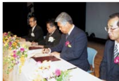
平成13年／友好都市調印式