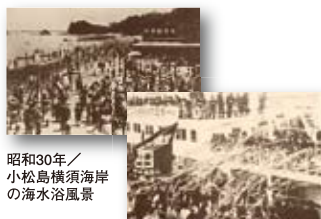
昭和30年／小松島横須海岸の海水浴風景