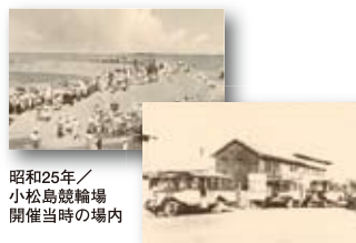
昭和25年／小松島競輪場開催当時の場内