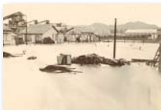
昭和36年／第二室内台風来襲