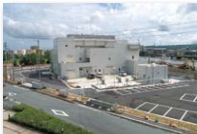
平成19年／小松島雨水ポンプ場完成