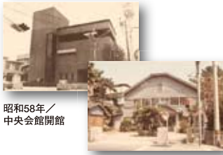
昭和58年／中央会館開館