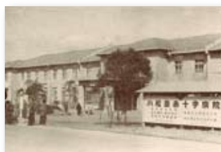
昭和26年／日本赤十字病院誘致