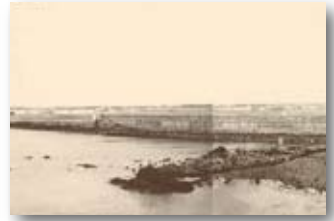
昭和48年／建設中の金機1.5万トンバース