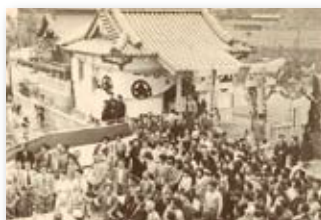
昭和32年／金長たぬき大明神社建立