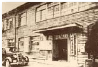
昭和26年／合併当時の市役所