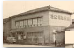
昭和35年／社会福祉会館開設