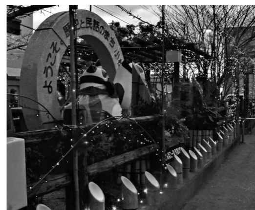
ライトアップされた広場の様子

初日の12月22日に行われた点灯式には多くの市民の方々が訪れ、冬の装いとなった広場を見学されました。