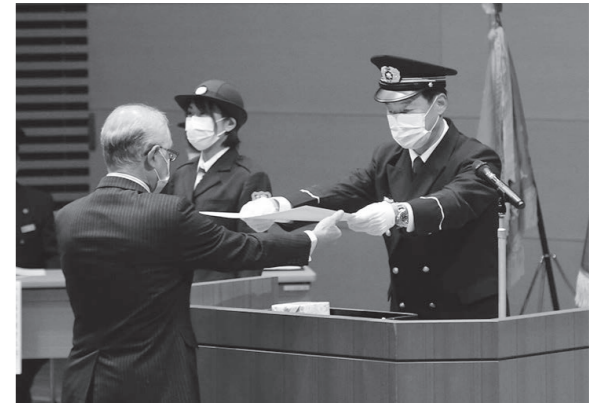
被表彰者の方に感謝状を手渡す中山市長