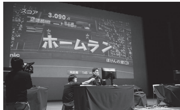
パワフルプロ野球の解説をするはるまき選手

また、eスポーツの体験コーナーも開設され、多くの子どもたちがゲームを楽しめました。