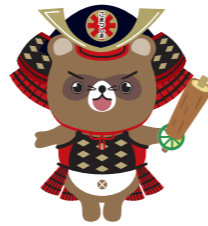
小松島市観光PRマスコットキャラクター「こまボン」