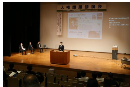
サウンドハウスホールで行われた 人権問題講演会