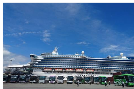
豪華客船が寄港している赤石港