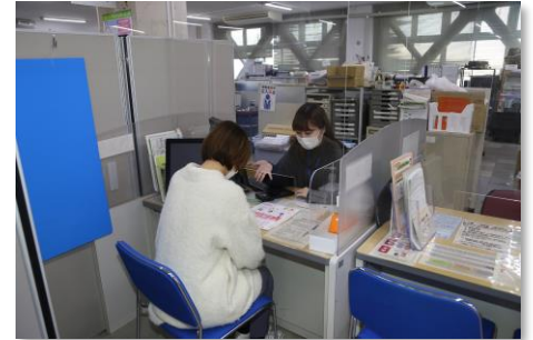
マイナンバーカード交付申請受付の様子