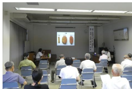
生涯学習センターでのふるさと講座