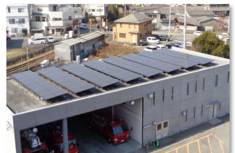
公共施設に設置している太陽光パネル