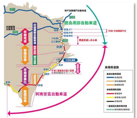
高速道路ネットワーク