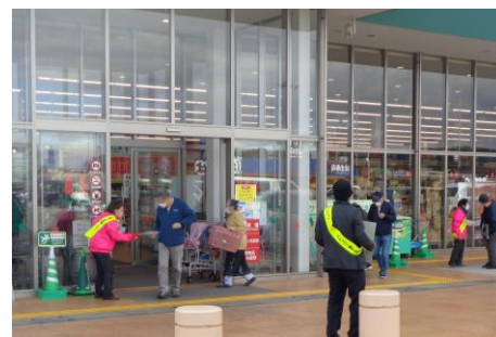
消費者被害防止キャンペーン