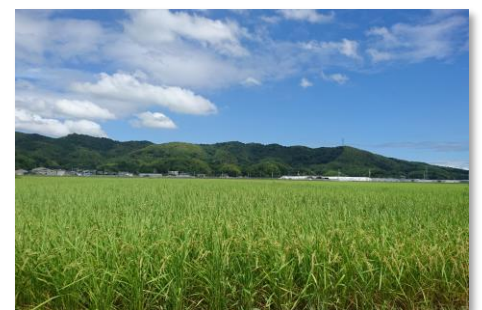
檜淵町の田園風景