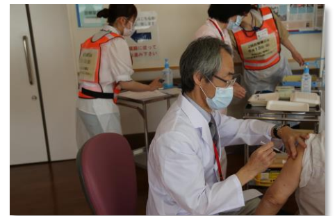
新型コロナワクチン集団接種の様子