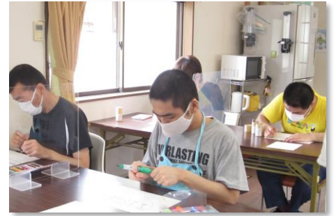
障がい福祉サービス事業活動風景