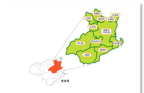
定住自立圏のイメージ