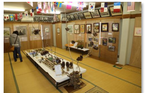
立江公民館文化祭