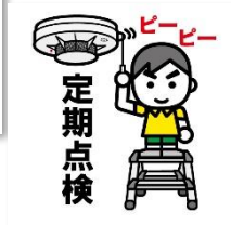
住宅用火災警報器