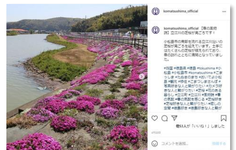
小松島市公式Instagramの投稿記事