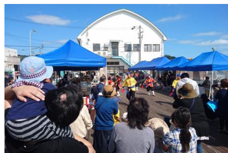
ウッドデッキ周辺でのみなとマルシェ