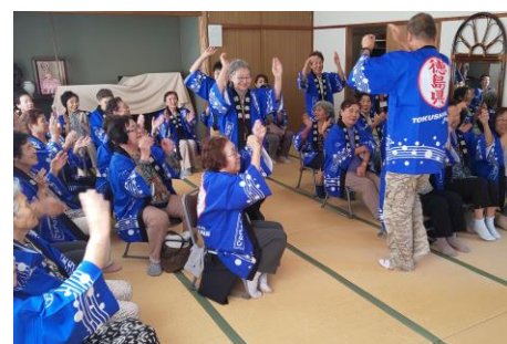
南サロン「のぞみ」での活動の様子