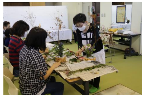
小松島市芸術祭での生け花教室