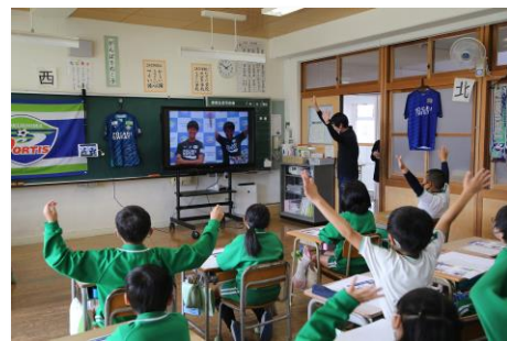
小松島小学校で行われた徳島ヴォルティスの選手とのオンライン交流会