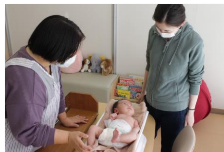
母子健康包括支援センター「おひさま」