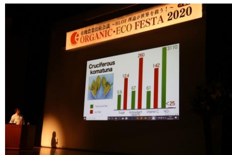
オーガニック・エコフェスタ (有機農業技術会議)の様子