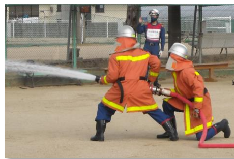
小松島市総合防災訓練における放水訓練