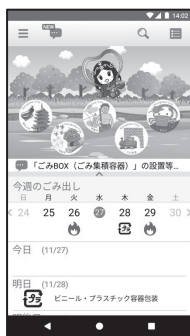
ごみ収集カレンダー