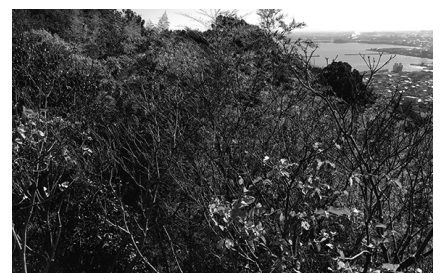
手入れの行き届いていない山の現状

ないか。 産業振興部長 本市を取り巻く状況は人口減少傾向にあり、農業者人口は急激に減少している。そのため、特に山間部において山の手入れが行き届かなくなっている。本市の実情に応じた取組を今後検討したい。