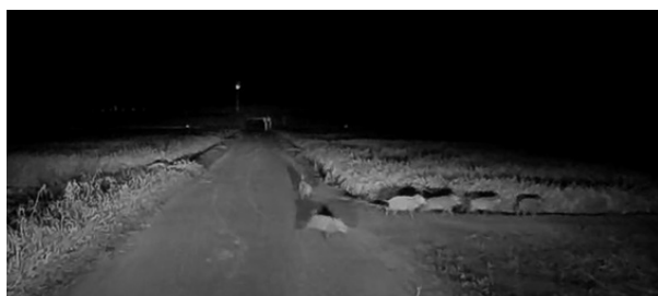
市内に出没したイノシシ