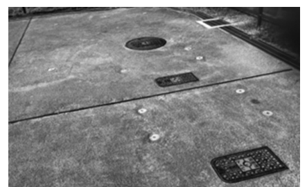
工地（たくむじ）いのち山のマンホールトイレ

吉見 那賀川町の工地（たくむじ）いのち山（180人収容）はマンホールトイレが3個ある。和田島町の希望の丘はない。設計ミスではないか。