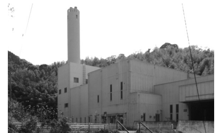
環境衛生センター

橋本 松茂町は防衛省から補助金が出るということで事業撤退を表明して 市民環境部長 環境省の交付金を含め、本市にとって有利な財源があるか確保に努めたい。