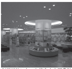
利用可能になった徳島市立図書館