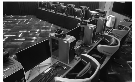
県のeスポーツ施設

総務部長 若い世代が中心となり、地域のにぎわいづくりに大変魅力的なものと考えているが、大会の開催にあたり賞金、商品が与えられるのであれば、具体的な実施に当たっての収支や法的整理など課題を検討する必要があるため、今後も研究を行う。