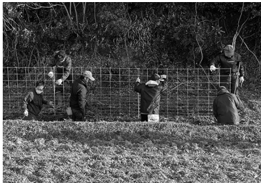
イノシシ侵入防止柵

場所が離れ、共同で防護柵ができないところに補助をしたり、箱わなを増やす、特別捕獲事業を行うなど対策を考えては。 産業振興部長 地域一体となり、イノシシ等の有害鳥獣からの農作物被害を防止する補助制度を十分活用できるように、制度の周知を図りたい。