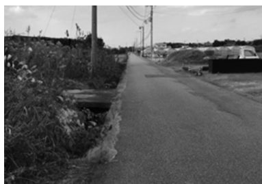
市道和田島36号線と用水路

を守ることに、市は最優先に取り組み義務がある。 都市整備部長 危険な箇所と認識。市道和田島36号線は約600m区間で農業用水路が併設しており、市道との高低差がある。防止柵は率にして12%と、実態に即した計画的な整備が進んでいない。市直営で反射式道路びょうを12月5日より着手、