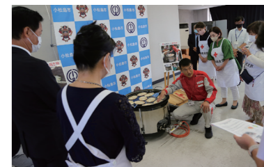
説明を聞く参加者

なお、寄贈いただいた鉄板を活用し、来る11月12日(日)開催の「令和5年度小松島市総合防災訓練」で炊き出し訓練が実施される予定です。市民の皆さま、ぜひご参加ください。