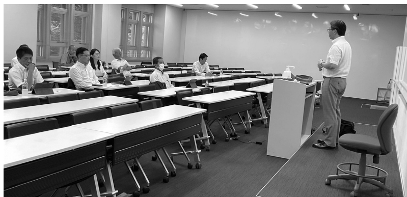
早稲田大学マニフェスト研究所

改革度調査に関する内容や各自治体での議会改革の取組、議員間の合意形成の仕組み、議会と事務局の役割などについて講義を受けた。議会だよりの内容について、どの程度の割合が読まれていているか、少数派の意見に対し、議論を尽くしていくことこそ議会としての役割であること、会派等を超えて意見を交わすことの重要性など、議会改革特別委員会をはじめ、小松島市議会が挑むべき次の課題を明確化した。