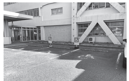
本庁舎の障がい者等用駐車スペース

ており、この数字については近隣の自治体と比較しても妥当ではないかと考える。まずは既存の駐車スペースについて、車椅子のマークやラインの塗り直し等駐車スペースの環境整備、パーキングパーミット制度の周知を行いたい。