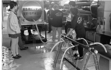
断水のため非常用飲料水を配布 ＝沖縄県宜野湾市