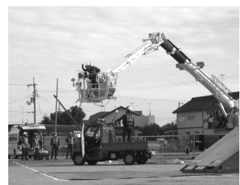
市防災訓練(令和3年度)

合防災訓練で、ペット同行避難訓練を行っては。 危機管理部長 11月12日に実施する総合防災訓練の中で、ペット同行避難訓練も行う計画である。また徳島県動物愛護管理センターに協力してもらい、ペット防災に関する講習会の実施やペットの