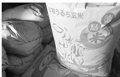
配布1袋を30kg等米1等検査

廣田 水稻農家支援で、最終幾らの支援金が申込みのあった水稻農家に支払われるのか。