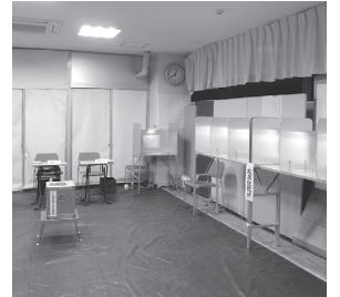
市役所期日前投票所

選挙管理委員会事務局長 期日前投票所は市役所に設置しており、職員がすぐに対応でき、安定的に運営できるメリットがある。商業施設で行う場合、場所にも考慮していく必要があるため今のところ行う予定はないが、投票率アップにつながる啓発活動の充実に取り組みたい。