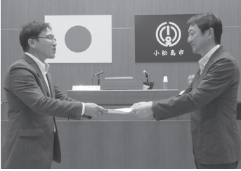
南部委員長（左）から池淵議長へ評価報告書を提出

当委員会は、令和4年度の一般会計・競輪事業・後期高齢者医療・住宅新築資金等貸付事業・国民健康保険・土地取得事業・介護保険・下水道事業・水道事業についての会計決算と、令和5年度の一般会計の補正予算審査をし、いずれも認定・可決した。また、専決処分の報告を受けた。 議会が抽出した9事業について事務事業評価を行った。