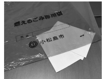
底が抜けたごみ袋

購入された皆様には、心よりおわびを申し上げたい。不良品の有無にかかわらず、該当ロット番号の全8万4千枚を交換対象とし、新聞折り込みチラシでの広報、また市内でごみ袋の納入実績のある店舗に赴き、不良品に関するおわびと回収を行うことなどを製造業者と確認した。