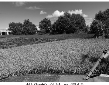
耕作放棄地の現状

農業委員会事務局長 農地利用最適化推進委員等で、毎年雑草、雑木が繁殖していないか農地利用状況調査を実施している。