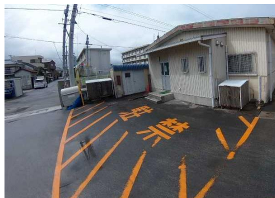
既存小学校における給食用食材運搬車の転回スペース