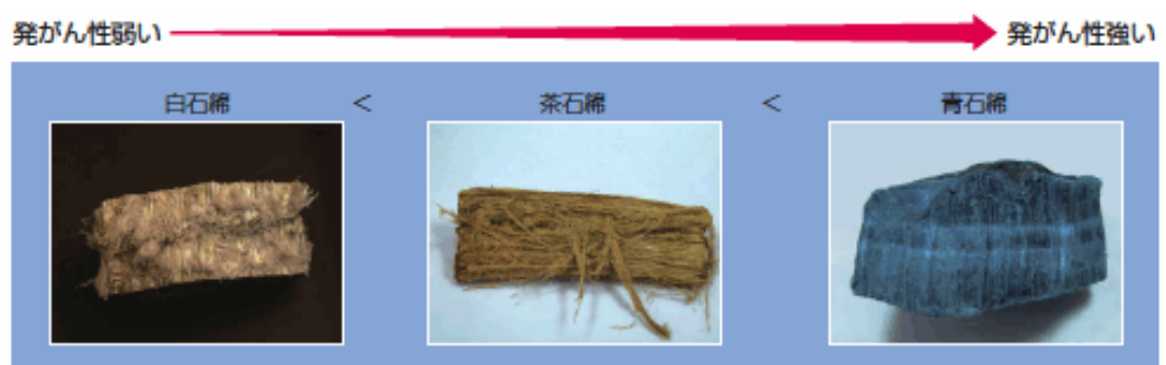
図1 石綿の種類と発がん性

しかし、石綿は肺がんや中皮腫を発症する発がん性が問題となり、現在では、原則として製造・使用等が禁止されています。その発がん性は次のようになります。