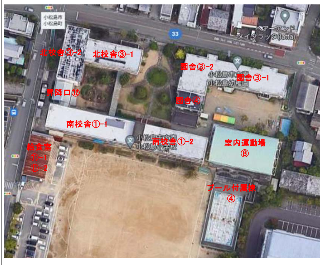
図 2-1 調査位置図【南小松島小学校】