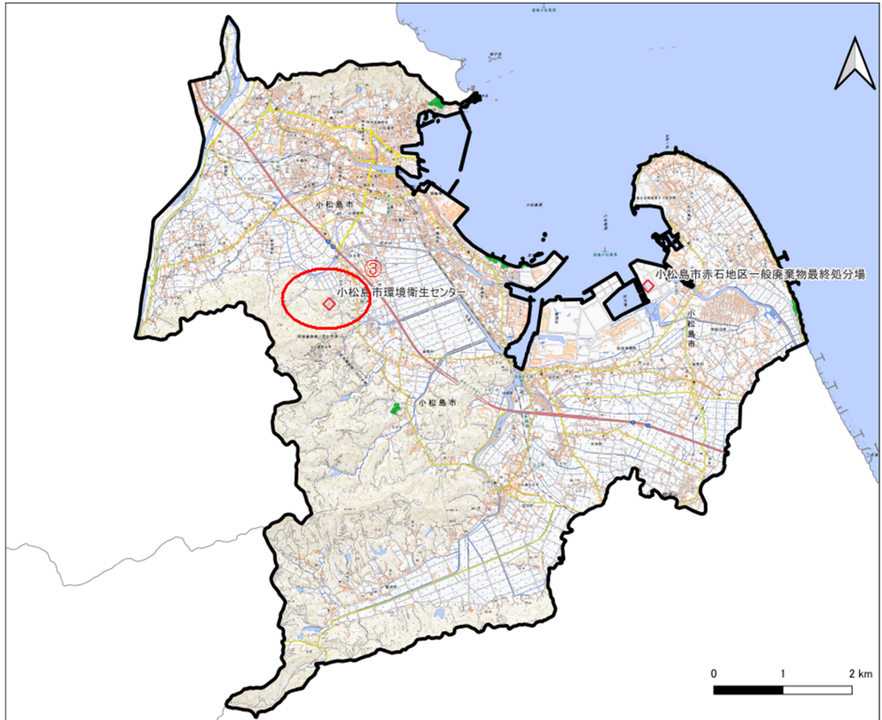
図 4.1 最終候補地位置図

ごみ処理施設整備候補地選定は小松島市内全域を対象とした。立地条件、自然環境、社会・生活環境、防災、経済性、用地取得の見込みを考慮した客観的評価による検討を行い、総合評価として『最終候補地』を選定した。最終候補地の位置図を図 4.1 に示す。