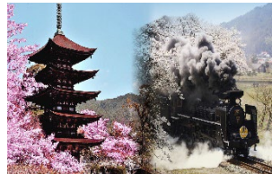
▲日本三名塔の一つ「瑠璃光寺五重塔」と「SLやまぐち号」