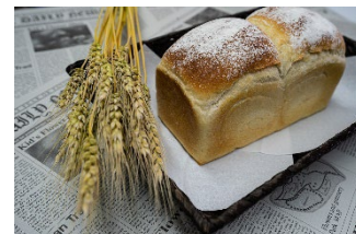
▲北海道産小麦ハルユタカ を使って焼いたパン