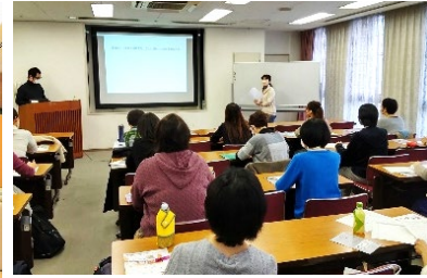
▼就職セミナーの様子