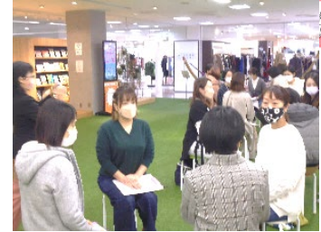
▲参加者同士の交流の様子 (市内百貨店内「コトサイト」にて開催)