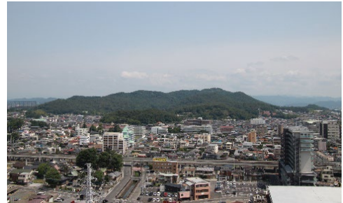
◀市役所から見えるぐんま百名山の「金山」