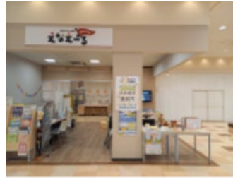
▼恵那中央出張所えなえーる