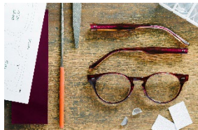
▲眼鏡産業を中心としたものづくりのまち