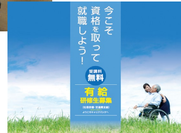
▲介護人材養成支援事業