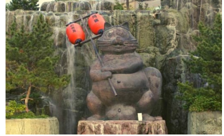
▲市民から親しまれる「金長だめき」の銅像