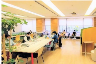
▼コワーキングスペース