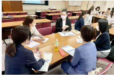
▼女性リーダー育成研修