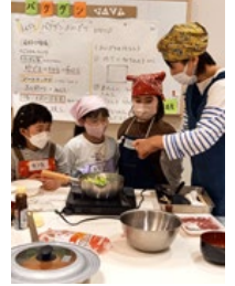
▼子どもおにぎり教室