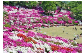
▲約5万株のつつじが咲く西山公園