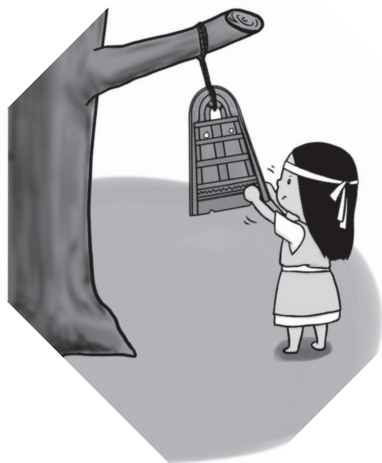
勢合銅鐸を鳴らすシャーマン