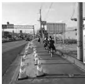
歩行者・自転車環境の良好な整備

都市整備部長 小松島中学校周辺の交差点から源氏橋までの東側を令和5年7月から令和6年2月の工期で事業の整備を実施。西側歩