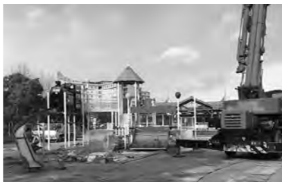
インクルーシブ遊具設置工事

政策監 S.L記念広場では、インクルーシブ遊具の設置工事を進め、令和6年1月下旬の竣工を目指している。また、新たな駐車場が令和5年11月14日に完成。小松島ステーションパーク全体の改修工事を行うため、詳細設計業務の公募をプロポーザル方式で令和5年12月1日から開始した。