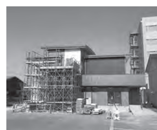
女子選手対応宿舎(建設中)