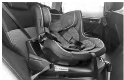
チャイルドシート