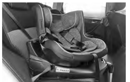
チャイルドシート

は、安いものでもおよそ1万円。金銭面での負担が大きく、必要と分かっているが購入が難しいと困っている方がいる。本市で、チャイルドシートのレンタルもしくは補助金の支給の検討はできるのか。