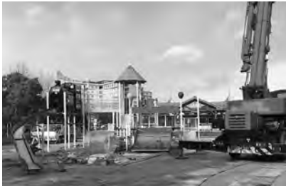
インクルーシブ遊具設置工事