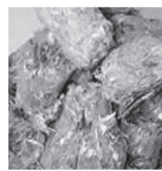
燃料固形

向、社会経済情勢等について情報収集に努めながら、課題を解決できるように取り組みたい。