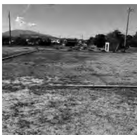
ゲートボール場予定地