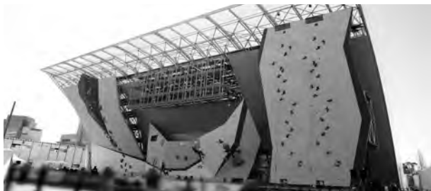
クライミング施設イメージ