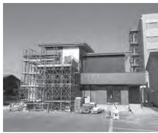
女子選手対応宿舍(建設中)

現在、改装も終わり、令和5年内には足場も撤去する予定。契約工期の令和6年3月18日の竣工目途となっている。