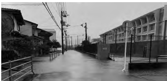
令和4年9月浸水状況

年12月に知事より都市計画事業として実施することを認められた。 安平 5年ほど前に、川南ポンプ場を新設するために用地を先行取得するという話があったが、どうなったのか。 都市整備部長 隣接地の更地を一つの候補地として選定し、幾度となく協議を重ねたが合意には至らなかった。