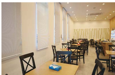
居心地の良い休憩室。集中力が必要な業務なので、1時間半に1回10分間の休憩があります（この10分間は有給扱い）。

アウトソーシング事業を展開する『うるるBPO』（本社・東京都中央区）。BPOサービスはデータ入力・データスキャンを中心に、DM発送・システム開発など多岐に渡り、2023年1月現在で取引社数約5,400社に対し、ビジネスの効率化・合理化を支援しています。『うるるBPO徳島センター』は、契約書等の書類をデジタル化するスキャンサービスに特化したオフィスで、2019年4月に開設されました。現在は約150名が働いており、このうち約7割がフルタイム勤務で、これまで小松島市にはなかった“オフィスワーク事務”という新たな働き口の創出になっています。