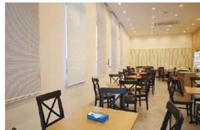
居心地の良い休憩室。集中力が必要な業務なので、1時間半に1回10分間の休憩があります(この10分間は有給扱い)。