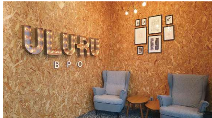
「ここで働きたい!」と思ってもらえるよう「徳島で一番お洒落なオフィスに」をコンセプトに設計された「うるるBPO徳島センター」。

アウトソーシング事業を展開する「うるるBPO」(本社・東京都中央区)。BPOサービスはデータ入力・データスキャンを中心に、DM発送・システム開発など多岐に渡り、2023年1月現在で取引社数約5,400社に対し、ビジネスの効率化・合理化を支援しています。「うるるBPO徳島センター」は、契約書等の書類をデジタル化するスキャンサービスに特化したオフィスで、2019年4月に開設されました。現在は約150名が働いており、このうち約7割がフルタイム勤務で、これまで小松島市にはなかった「オフィスワーク事務」という新たな働き口の創出になっています。