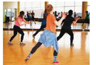
運動や学び・趣味が楽しめるスタジオ