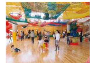
親子で遊ぶ子どもの遊び場