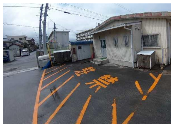
既存小学校における給食用食材運搬車の転回スペース