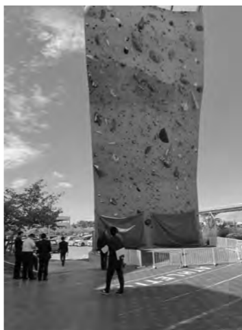
岸和田カンカンベイサイドモール

産業建設常任委員会の委員11名及び議長が、令和5年10月10日に岸和田カンカンベイサイドモール（大阪府岸和田市）、令和5年10月11日に桜ヶ池クライミングセンター（富山県南砺市）を視察しました。クライミング施設、館内関連施設の見学、年間利用者数や収益、施設整備及び運用に関する影響等について質疑応答を行いました。