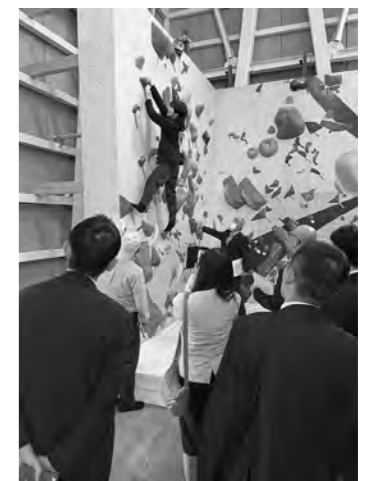
桜ヶ池クライミングセンター