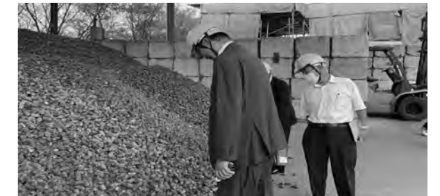
固形燃料を見学する委員