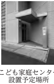
こども家庭センター設置予定場所