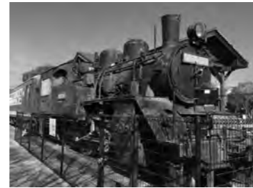
S L 記念広場の機関車

都市整備部長 機関車等の塗膜調査を実施した後、ガバメントクラウドファンディングを通じ支援の拡充を図り、令和6年度中に塗装工事の完成を目指したい。