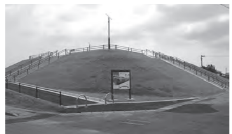
ニュータウン地区の命山