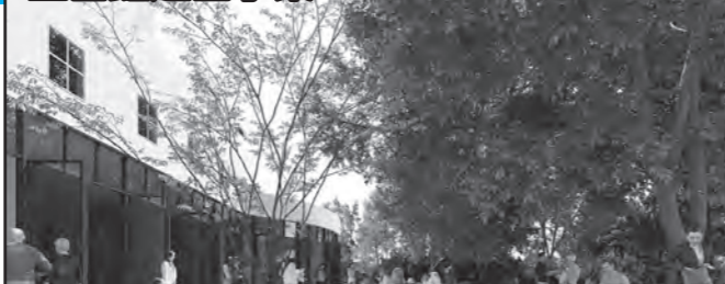
市立図書館とためき広場の連続した空間イメージ(案)