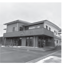
女子選手対応宿舍

ホームページの地域防災計画資料編に備蓄の個数は入っているが、より詳しい状況が出せるよう検討したい。