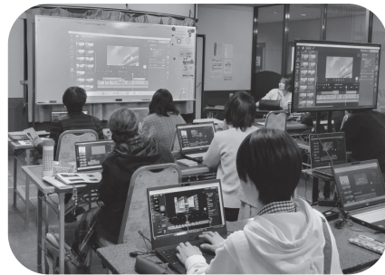
セミナーなどの様子