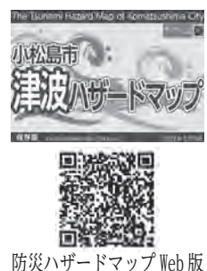
防災ハザードマップ Web版

知や県と連携し講演を行うなど啓発に取り組んできたが、再度周知が必要だと判断し、広報に令和6年6月、9月にも掲載する予定。