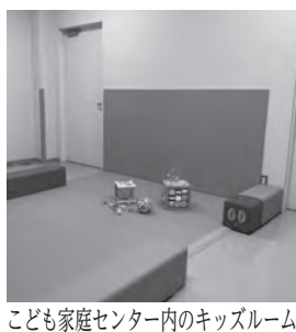
子ども家庭センター内のキッズルーム