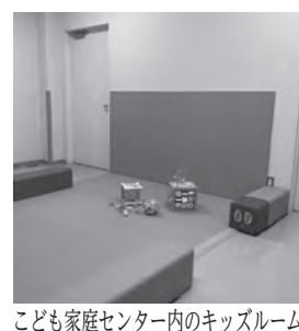
子ども家庭センター内のキッズルーム

子ども家庭センター（令和6年7月1日設置予定）について、目的、役割、組織体制等について説明を受けた。