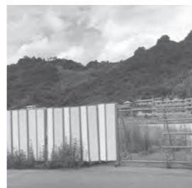
日峯大神子広域公園の現状