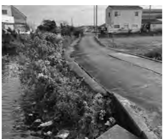
和田津川沿いの現状