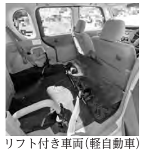
リフト付き車両(軽自動車)

総務部長 内容に応じた対応や標準的な対応期間の目安を設定した運用を各課に周知している。統一的なマニュアルはない。