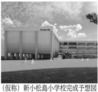
(仮称) 新小松島小学校完成予想図