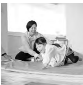
こどもユレタキャラバン

副教育長 活用について、校長会等で情報共有したい。 ※こどもユレタキャラバンは地震の揺れ体験等を通して、安全向上