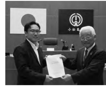
南部委員長（左）から安平議長へ評価報告書を提出

当委員会は、令和5年度の一般会計・競輪事業・後期高齢者医療・住宅新築資金等貸付事業・国民健康保険・土地取得事業・介護保険・下水道事業・水道事業についての会計決算と、令和6年度の一般会計・競輪事業・後期高齢者医療・水道事業会計の補正予算審査を行った。このうち競輪事業の補正予算は本会議で議案の撤回となり、新たな議案が追加提案され、当委員会で審査をし、いずれも認定・可決した。議会が抽出した9事業について事務事業評価を行った。