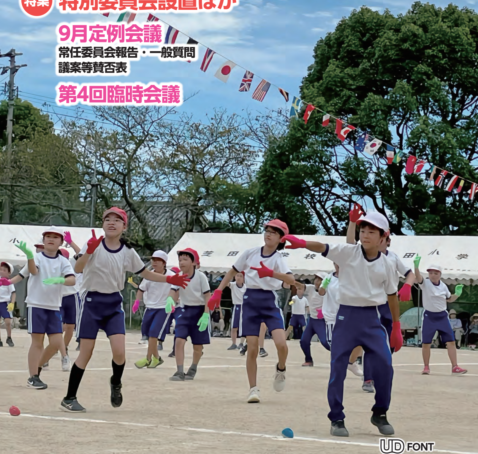
photo / 芝田地区全町運動会