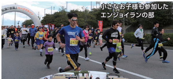
小さなお子様も参加したエンジョイランの部