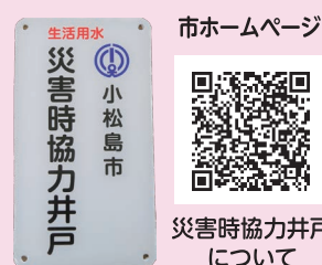
市ホームページ 災害時協力井戸について