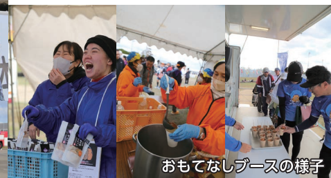
おもてなしブースの様子