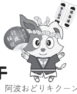
阿波おどりキーン