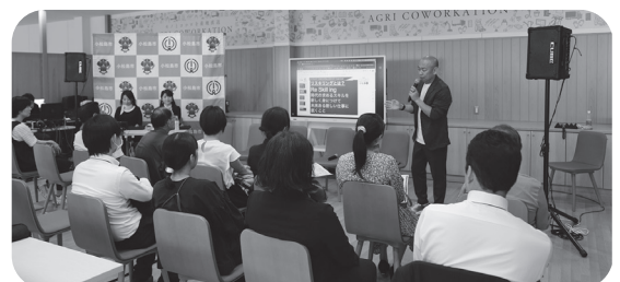
令和7年度リスキングセミナーの様子