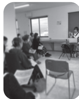
昨年のイベントの様子