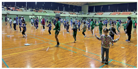
市民なわとび大会の様子

2月7日、「第48回小松島市民なわとび大会」を市立体育館で開催、小学生未満から一般の方まで総勢141名が参加しました。