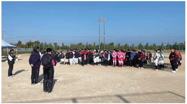
大会開会式の様子

本大会は1チーム6人の構成で、1人約1.2キロの周回コースを走り、総合タイムを競い合うもので、参加した子どもたちは、チームメイトで声を掛け合って健闘を誓い、号砲とともに勢いよくスタート。真冬の寒さに負けず、チームメイトや保護者から声援を受けながら、懸命にたすきをつなぎ力走していました。大会結果は次の通りです。