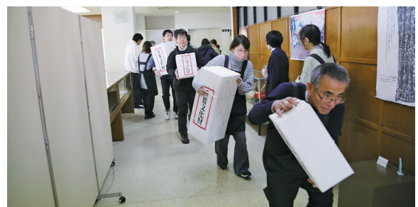
文化財を模した箱を持って避難する職員