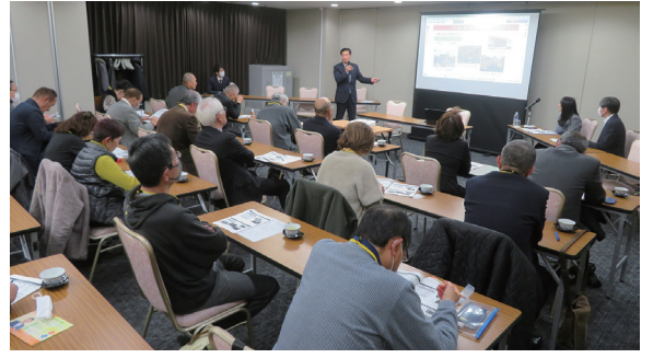
行政出前講座の様子

1月26日、民生委員児童委員連絡協議会研修会に市長が出席し、講座を開催しました。市長からは様々な施策の紹介、担当課である介護福祉課から福祉行政の現状と課題についての説明があり、参加者の皆さまとの意見交換を行いました。