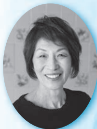
浜内千波 (料理研究家・栄養士)