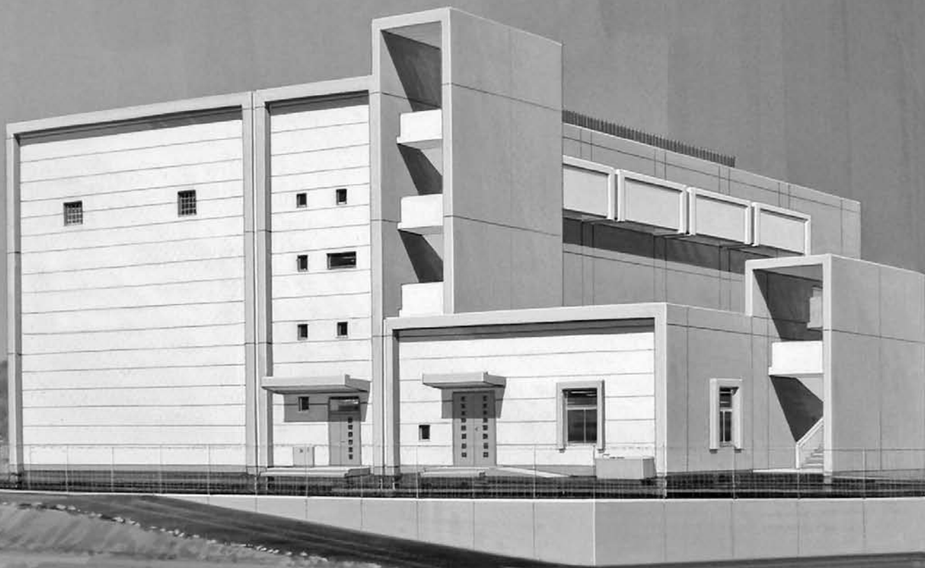
金磯南雨水ポンプ場完成予想図

金磯地区の浸水対策として、平成25年度までに金磯南雨水ポンプ場および金磯2号雨水幹線最下流区間を整備する予定です。金磯南雨水ポンプ場は、鉄筋コンクリート造の地上3階・地下2階建（延床面積1,959㎡）で、ポンプを口径450mm 2台と口径1,350mm 2台の計4台設置。金磯2号雨水幹線最下流区間は、県道徳島小松島線からポンプ場までの約160mで内空3,600mm×1,700mmの暗渠を整備します。