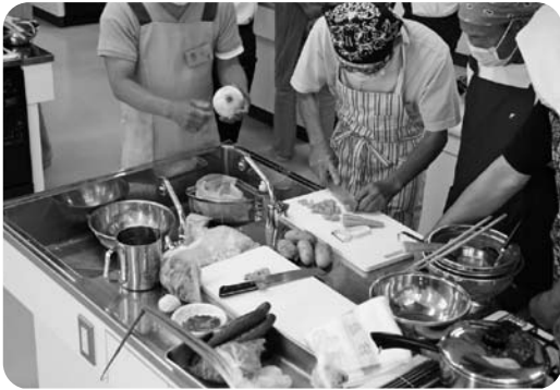
肉じゃが用の人参を調理する参加者

メタボ予防などを目的とした男性限定の料理教室が6月11日、市保健センターで行われました。これは市健康増進課が実施している特定健診の受診者のうち、一定の基準を満たす方を対象に料理教室の参加者を募集したもので、今回の料理教室には22名の方が参加し、肉じゃがやキュウリの酢の物などに挑戦。参加者らは調理実習を通して栄養に関する知識や食生活の大切さなどを学んでいました。