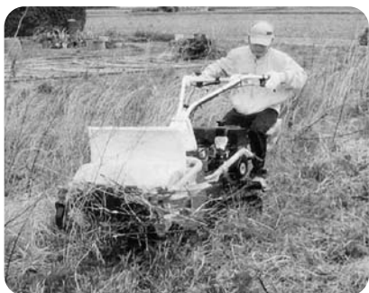
貸し出しされる歩行型草刈機

耕作放棄地の土地所有者、耕作者、土地改良区等関係機関で耕作放棄を解消したい方は、左記お問い合わせ先へ申請してください。