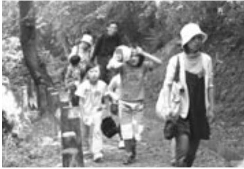
額に汗しながら、懸命にゴールを目指す小学生ら

参加者らは心地よい初夏の風が薫るなか、お互いチームの健闘を誓い、親睦を深めながら懸命にゴールを目指していました。