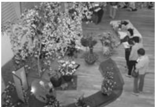
日本の四季「春」を感じさせるコーナーで説明を受ける来場者

また、小松島映像研究会によるビデオコーナー、茶道表千家同門会徳島県支部がお点前を披露し、おもてなしするお茶席、かもめ保育園園児による童謡など趣向を凝らせた催しもあり、大変賑わっていました。