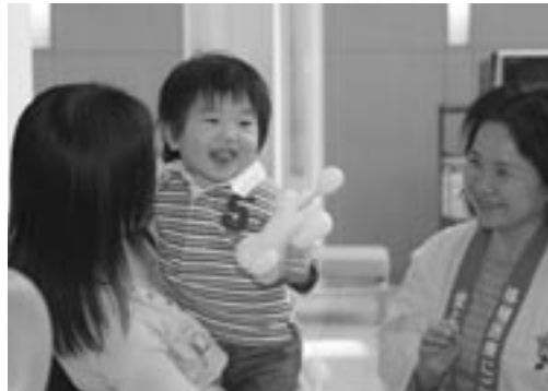
ブードルを形作った風船をもらい、満面の笑みを見せるお子さん

徳島赤十字病院を利用されている皆さんに、同病院を今まで以上に理解してもらい、相談などを通して病院職員との交流を目的に4月26日、第2回目の病院祭が同病院で行われました。