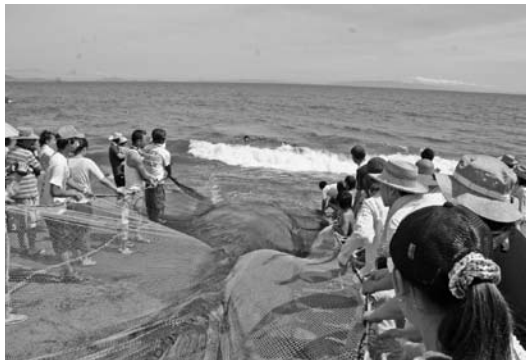
一生懸命に網を手繰り寄せる参加者ら

ベキューにするのですが、今年は波が高く、例年に比べ捕れた魚は少なめだったためバーベキューは実施されませんでした。子どもたちは地曳網の体験ができて大喜びでした。