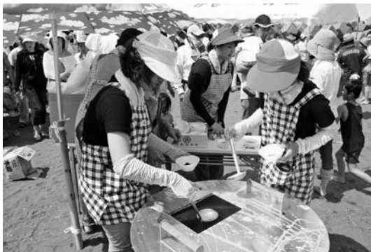
チリメンやわかめ味噌汁を振る舞う様子

開会式後には、地曳網の体験が行われ、沖に仕掛けられた網を来場者らが砂浜から一生懸命引き揚げていました。この地曳網では捕れた魚をその場でバー