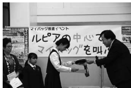
委嘱状などを渡されるマイバッグ隊員(左側3名)

また10月15日には、市内協力事業所でレジ袋配布中止時間が設けられ、マイバッグ持参を呼びかけていました。