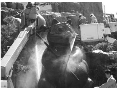
高所作業車でたぬき像を清掃

この清掃作業は、市からの依頼により、四国電力・四電工・四国電気保安協会らが協力。同社員らが高所作業車2台に分乗して高圧洗浄機を使い、約2時間の作業を実施し、たぬき像と希望の滝は見違えるほど綺麗になりました。