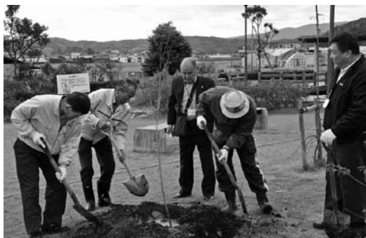
植樹するライオンズクラブの方と稲田市長