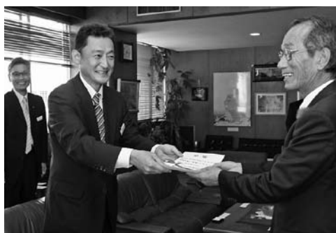
街路灯贈呈の目録を受け取る稲田市長(右)