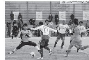
1月 市制施行60周年記念事業「ドリームサッカー」を開催