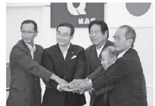
8月 四国横断自動車道（江田・中田地区）の設計協議が合意