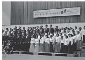
11月 第27回国民文化祭「まちが奏でるクラシック in 小松島市」